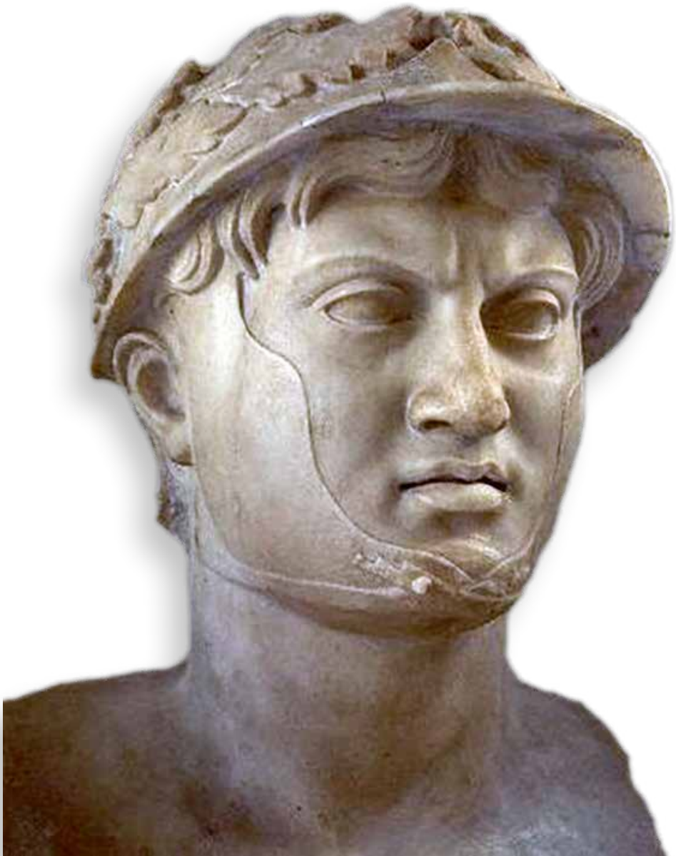
Busto di Pirro re dell'Epiro, Ercolano, da un originale del 290 a.C. Ora al Museo Archeologico Nazionale di Napoli