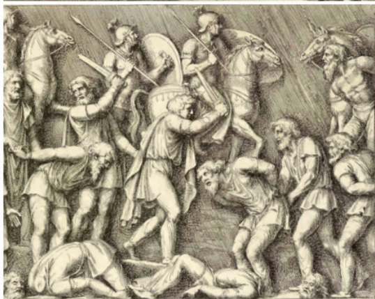
Pietro Santo Bartoli e Pietro Belloni, Columna Antoniniana Marci Aurelii Augusti: rebus gestis insignis germanis simul, et sarmatis, gemino bello devictis ex s. c. Romae in Antonini foro, ad viã Flaminiã, erecta, 1672

nemici. Nessuno dei casi menzionati, però, lascia pensare che i Romani sentissero il bisogno di scusare le proprie violenze, o che si sforzassero di rifiutare l’etichetta di “conquistatori avidi di sangue” tanto spesso applicata a loro dai loro nemici. Sarebbe anzi necessario domandarsi il motivo per cui questa etichetta di crudeltà sia stata applicata ai Romani dai loro nemici. Si deve notare che questa accusa è mossa anche dai Romani ai propri nemici (si pensi alla presentazione dei Celti, o alla “crudeltà disumana” di Annibale in Livio), come ben riconosce l’Autrice. Si deve senz’altro pensare che ognuno tentasse di enfatizzare le crudel-